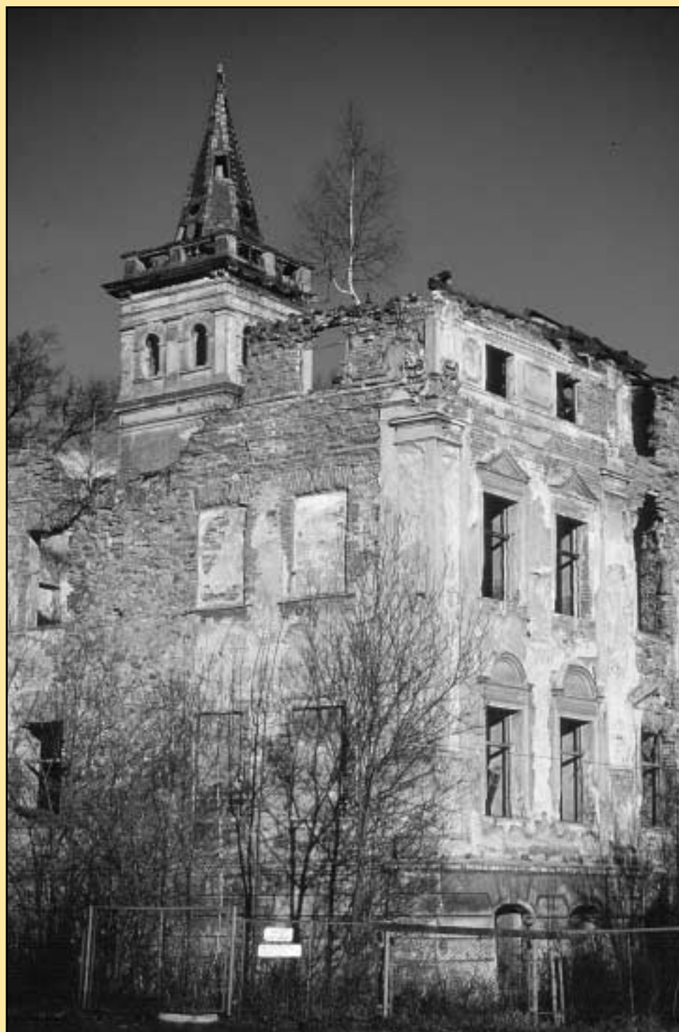
Berthelsdorf, Foto: Paweł Lipiński, 2001

W październiku 1945 pałac, splądrowany pod koniec wojny, został zajęty, później został urządony jako dom wypoczynkowy dla członków rządu, po kilku latach przeszedł pod zarząd miejscowego Państwowego Gospodarstwa Rolnego jako budynek mieszkalny dla pracowników. Po roku 1971 pałac popadał coraz bardziej w ruinę. Dzisiaj znajdują się tu tylko resztki pałacu.