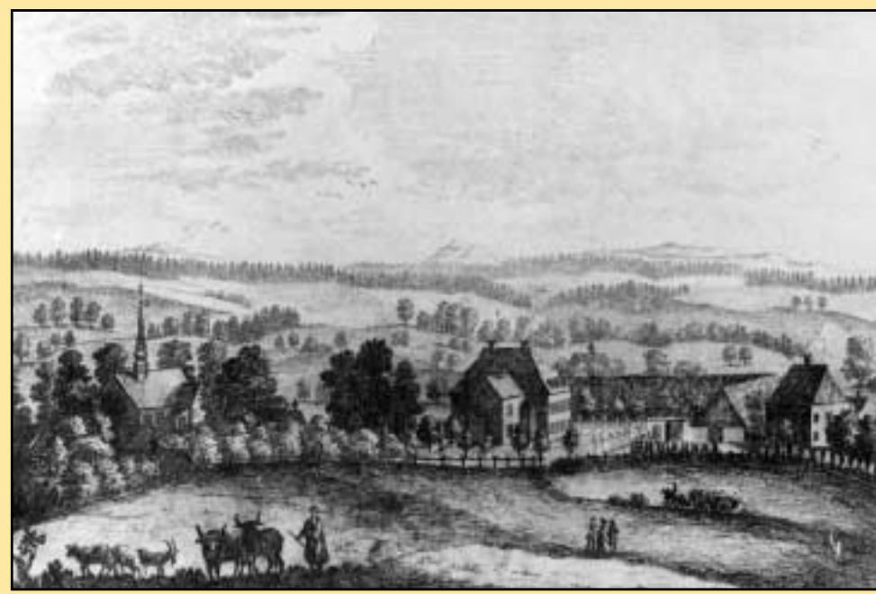
Berthelsdorf, Grafik, 1754

In der Literatur zu den Schlössern und Herrenhäusern Schlesiens wird Berthelsdorf nicht erwähnt. Vermutlich in der zweiten Hälfte des 16. Jahrhun-