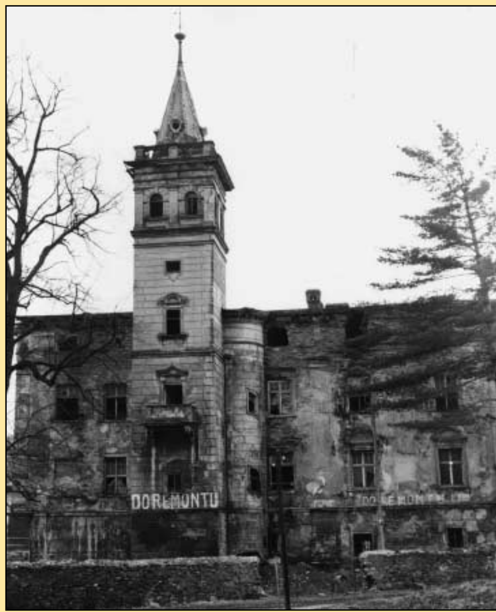
Berthelsdorf, Vorderansicht, 1981

derts wurde der Vorgängerbau des Schlosses errichtet. Dafür sprechen die Kelleranlagen sowie die profilierten Fenstergewände aus der Renaissancezeit, die im Erdgeschoß noch erkennbar sind. In der Ortschronik sind als frühe Besitzer die Familien von Zedlitz,