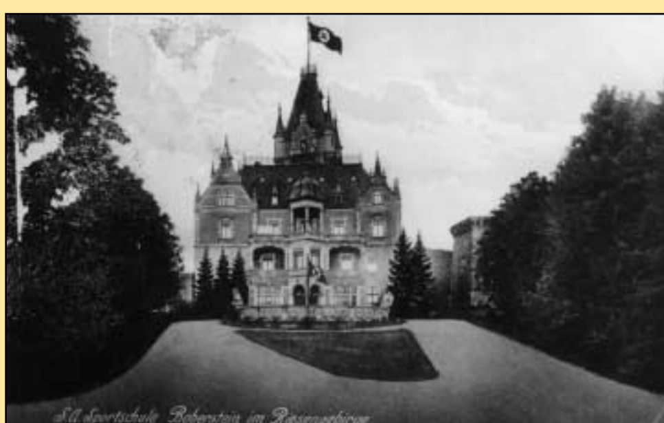
S.A. Sportschule auf Schloß Boberstein, Postkarte, um 1935

Po drugiej wojnie światowej pałac był wykorzystywany przez Armię Czerwoną, później jako obóz dla uchodźców politycznych z Grecji, a w końcu jako