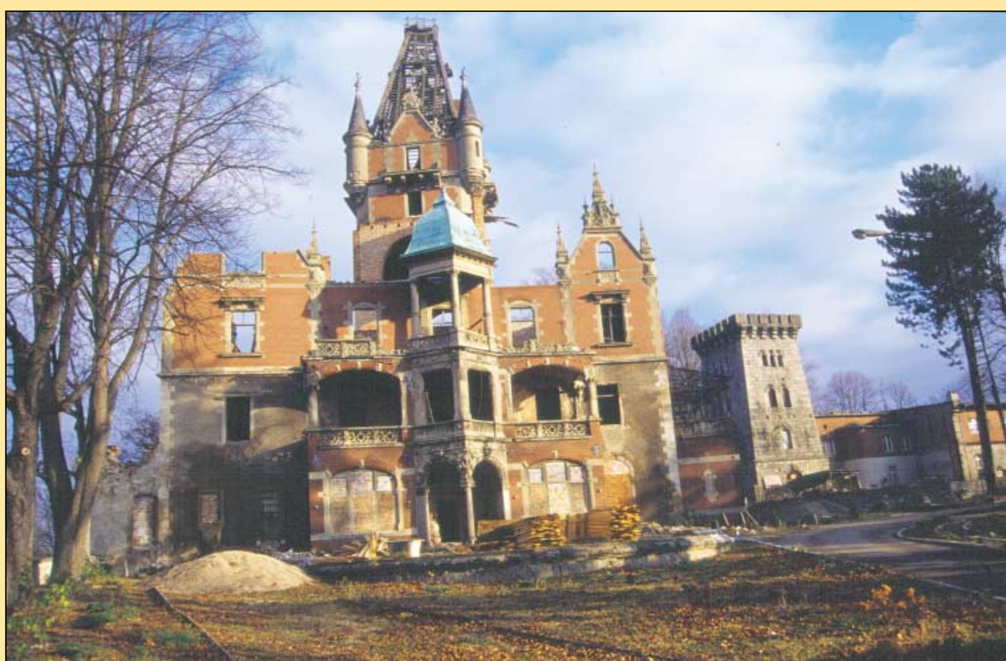
Schloß Boberstein, Foto: Paweł Lipiński, 2001